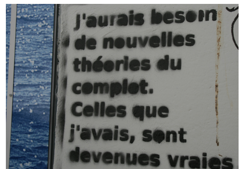
Pochoir à Douarnenez, rue Victor Hugo, août 2022