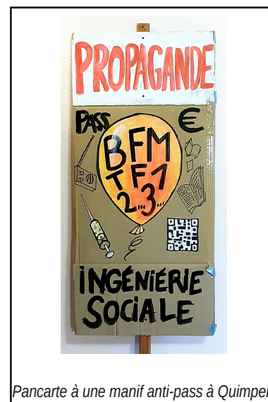
Pancarte à une manif anti-pass à Quimper