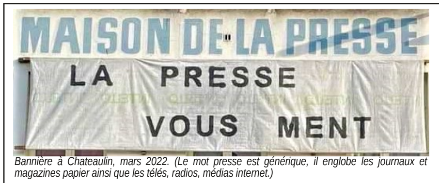
Bannière à Chateaulin, mars 2022. (Le mot presse est générique, il englobe les journaux et magazines papier ainsi que les télévisions, radios, médias internet.)